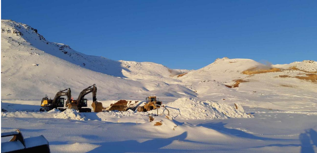
Eyðilegging í Krýsuvík – Almenningur fær ekkert um málið að segja þrátt fyrir Árórsarsamninginn

NSVE telur þetta vera skýlaust brot á Árórsarsamningnum þar sem almenningur fær enga aðkomu að málinu. Það er algjörlega ólíðandi að tilraunaborholur falli ekki undir leyfisveitingar með öllu tilheyrandi lögbundnu leyfisveitingaferli og aðkomu almennings, í stað samninga eins og þessa, sem gerðir eru í lokuðum fundarherbergjum og valda eyðileggingu svo dýrmætra náttúrusvæða.