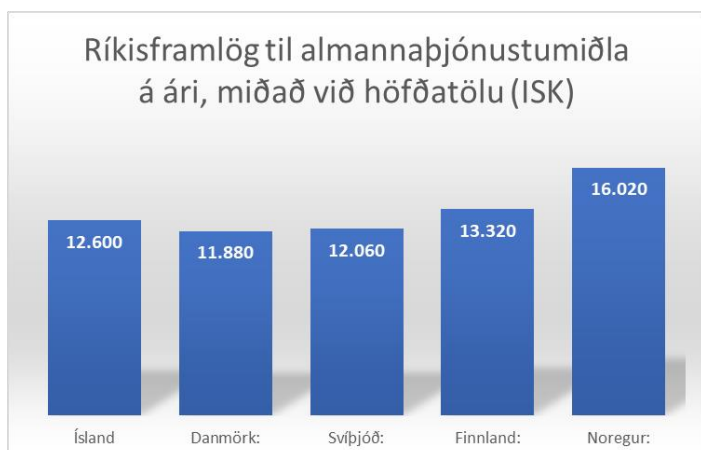
Mynd 3: Ríkisframlög til almannaþjónustumiðla á ári 2021, miðað við höfðatölu (tölur í ísl. kr.).