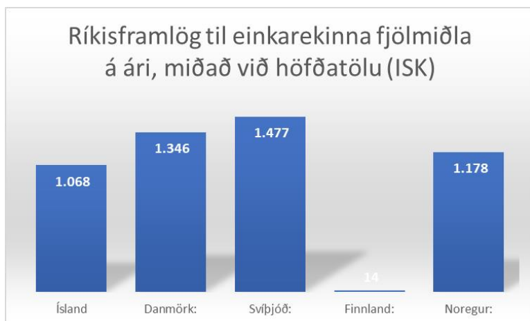
Mynd 4: Ríkisframlög til einkarekinna fjölmiðla á Norðurlöndunum 2021, miðað við höfðatölu. Heimild: Nordicom